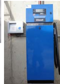
Zapfsäule Q-110T mit Tankautomat NRT 22