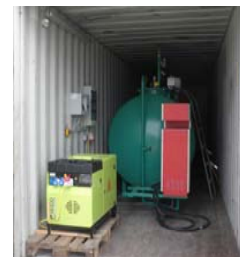
Containertankstelle mit Tankautomat NRT 22