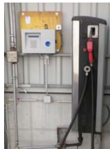
Installation Tankautomat NRT 22 mit Laptopkabel