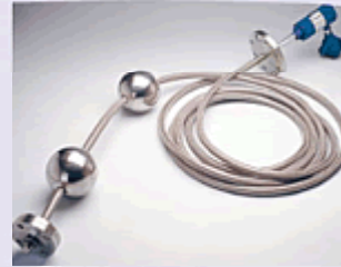
M-digital MAG-Sonden (ATEX)